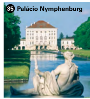
35 Palácio Nymphenburg