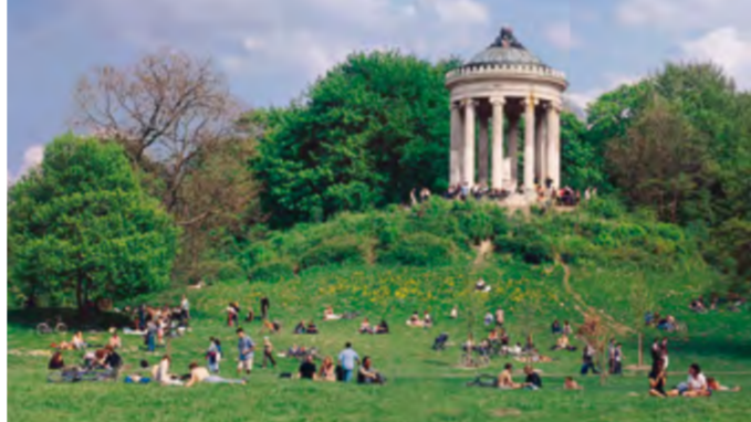
29 Jardim Inglês