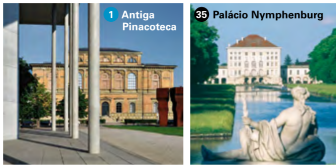
1 Antiga Pinacoteca

U2/8 Königsplatz, ônibus 100 Pinakothek, bonde 27 Pinakotheken